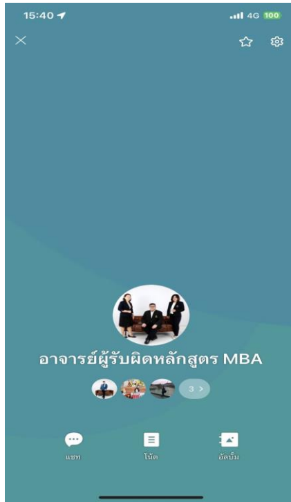
ภาพที่ 3 ห้องสนทนากลุ่มในสื่อสังคมออนไลน์ของอาจารย์ผู้รับผิดชอบหลักสูตร