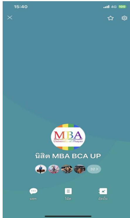
ภาพที่ 5 ห้องสนทนากลุ่มในสื่อสังคมออนไลน์ของอาจารย์และนิสิต

4.7 การประเมินผลผู้เรียนและกระบวนการต่าง ๆ มีการทบทวนและปรับปรุงอย่างต่อเนื่อง เพื่อให้มั่นใจว่ามีความสอดคล้องกับความต้องการของอุตสาหกรรมและสอดคล้องกับผลการเรียนรู้ที่คาดหวัง