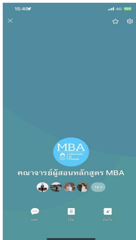
ภาพที่ 4 ห้องสนทนากลุ่มในสื่อสังคมออนไลน์ของอาจารย์ผู้สอน